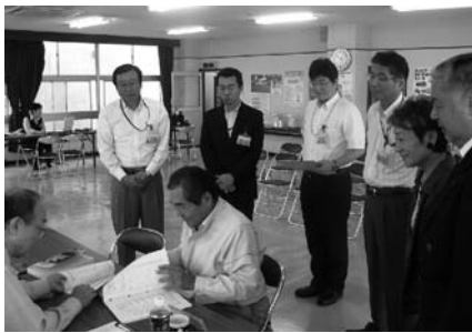
北原税務署長・板倉副署長の視察 (左から1人目) (左から2人目)