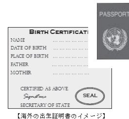
【海外の出生証明書のイメージ】