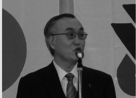
高畑県税事務所長