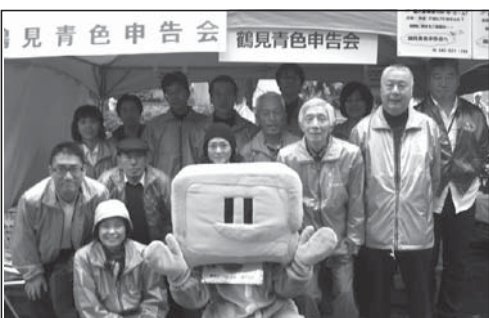
總持寺での広報活動(11/3)