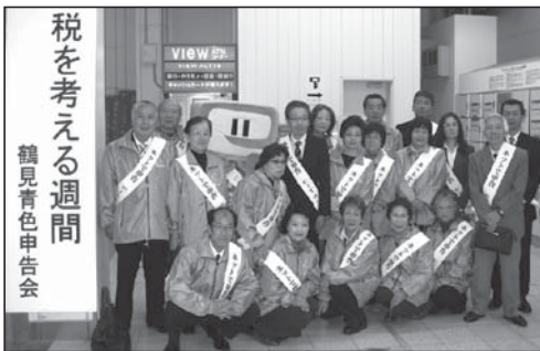
鶴見駅前広報活動の記念撮影(11/11)