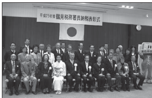
平成25年度納税表彰式(11/13)