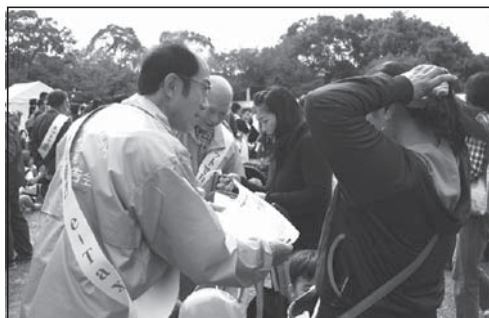
つるみ臨海フェスティバルにて(10/19)