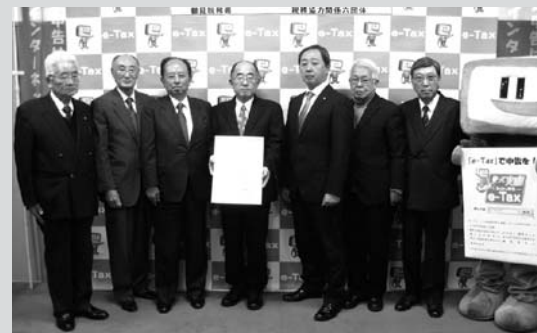
税務六団体の長によるe-Tax推進宣言式

役員の方々は毎日献身的に活動しております。皆様のご理解とご協力をお願い申し上げます。