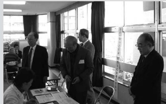
4階自書コーナー視察