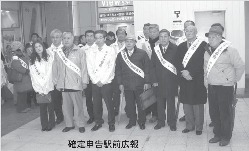
確定申告駅前広報