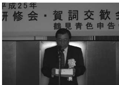
挨拶する鶴見税務署北原署長

続いて懇親会、クイズ、恒例のカラオケ大会と移り終始、和やかに過ごすごことができ無事に終了しました。